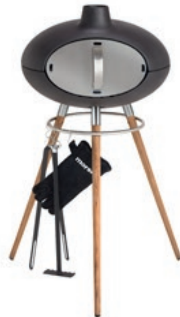
Morsø Grill Forno i emaljeret støbejern