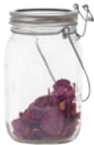
Solar Jar fra Menu