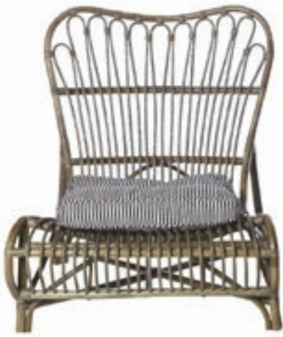
Colone stol fra House Doctor