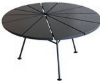
Bam Bam Table fra OK Design