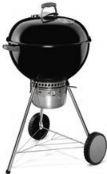
Weber Original Kettle Premium