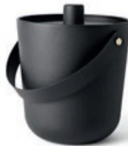
Fire Bucket fra Menu