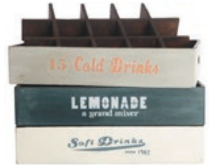
Sodavandskasser fra House Doctor