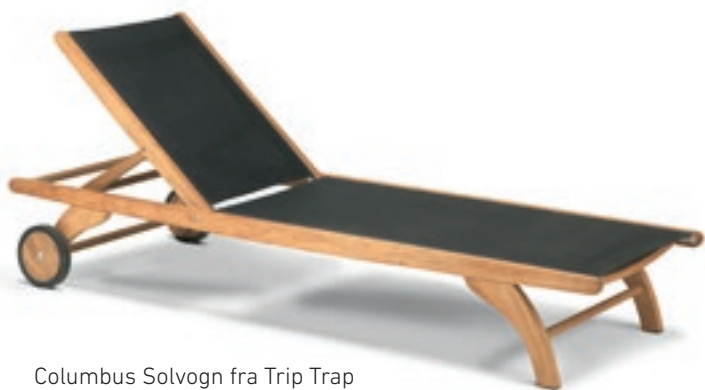
Columbus Solvogn fra Trip Trap