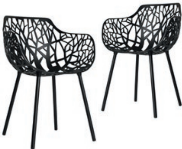
Forest armstole - Fast design www.casnovafurniture.dk