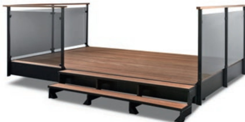
Dolle Terrasse i sort med bred trappe