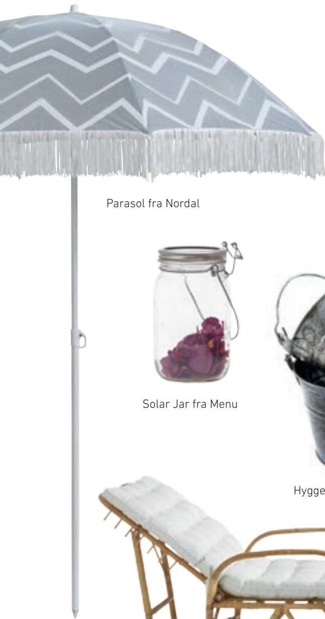
Parasol fra Nordal