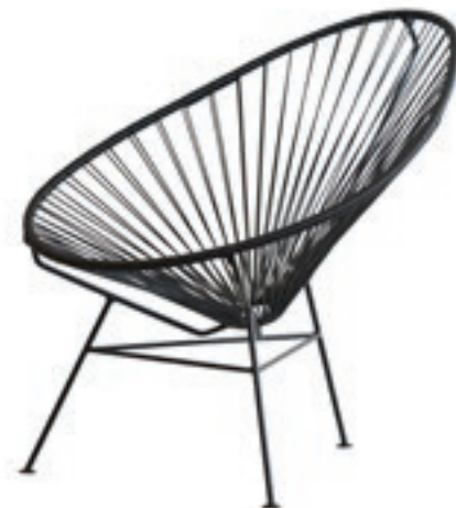
Alcapulco chair OK Design