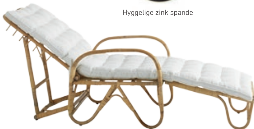
Original dansk liggestol fra liggestolen.dk