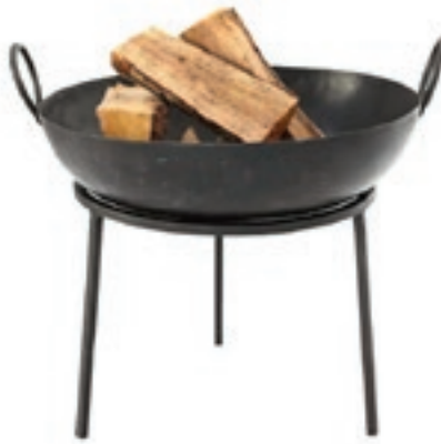
Bålsted fra House Doctor