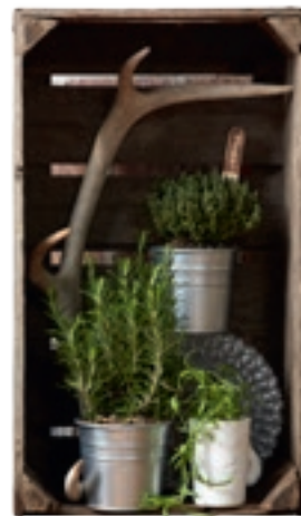
Køb gamle brugte æblekasser og pynt dem med blomster eller krydderurter