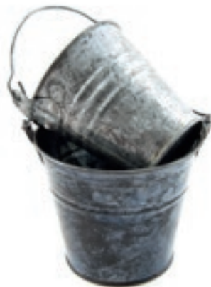
Hyggelige zink spande