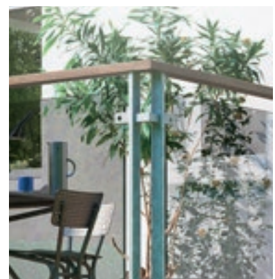
Smukt galvaniseret gelænder fra Dolle