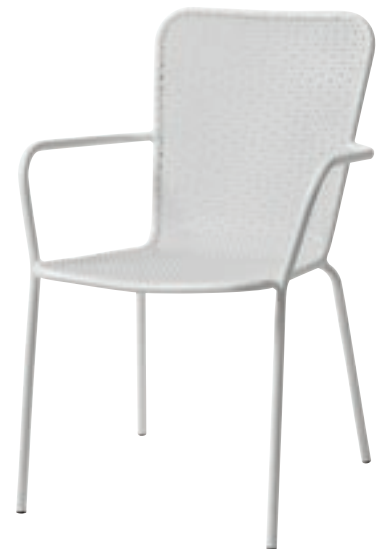
Smuk stol fra Nordal